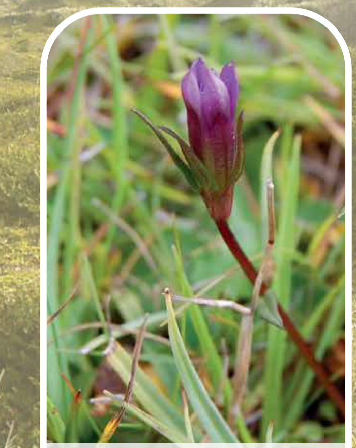
Crwynlys y twyni Dune gentian

Top of wildflower league The entrance to one of the most florally diverse sand dune systems in Wales is only a short way inland. It's home to the nationally rare dune gentian and a variety of colourful wildflowers including many species of orchid. Snack time The very rare beachcomber beetle (or 'strandline' beetle) shelters under driftwood on the beach and looks out for a favourite snack - sandhoppers.