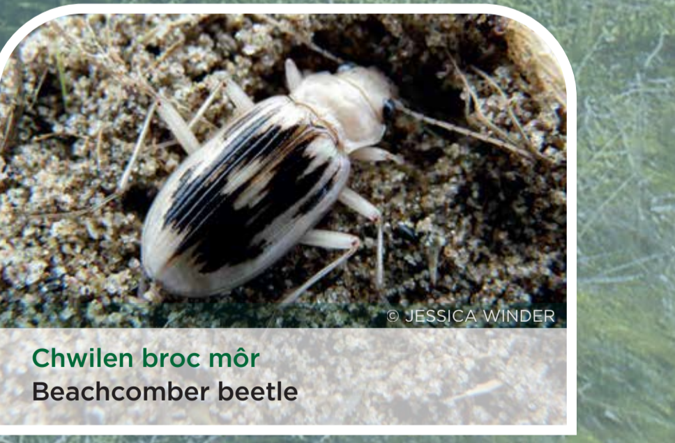
Chwilen broc môr Beachcomber beetle