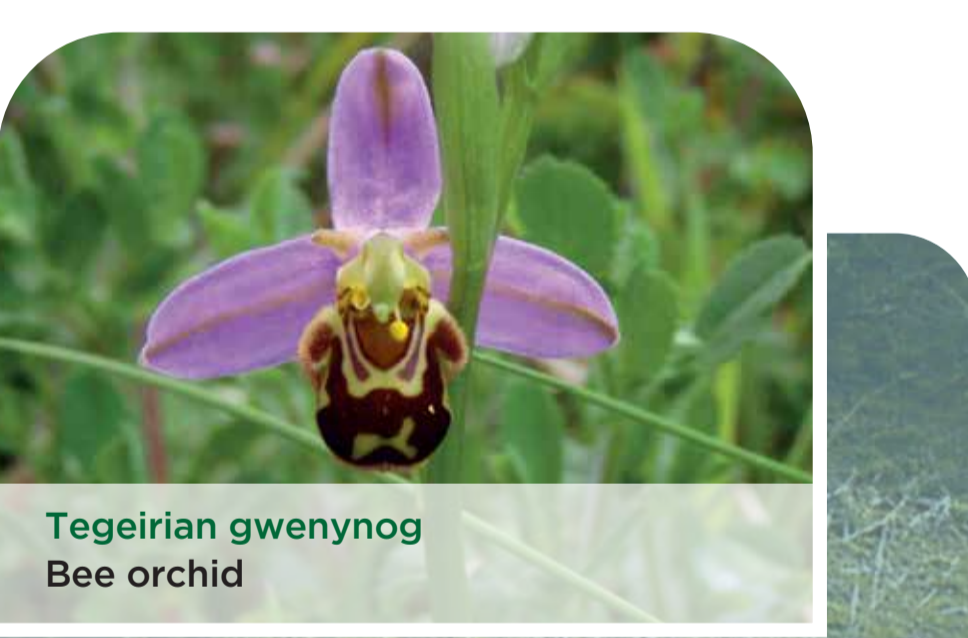
Tegeirian gwenynog Bee orchid

ER MWYN EICH DIOGELWCH CHI: Peidiwch â phalu tyllau neu dwneli yn y twyni tywod - mae tywod yn gallu dymchwel a'ch mygu chi. Byddwch yn ymwybodol o fwd/tywod meddal sy'n suddo a pheidiwch â mynd allan i'r foryd - mae'r llanw yn gallu eich ynysu'n gyflym. Edrychwch i weld beth yw cyflwr y llanw. Peidiwch â chyffwrdd ag unrhyw weddillion milwrol - gallai ffurwdro! Rhwng wybod i'r Heddlu am unrhyw bethau amheus drwy ffonio 999. I helpu adar Oxwich, cadwch gw'n ar ddenyn o fis Mawrth tan fis Gorffennaf i ddiogelu adar sy'n nythu ar yr arfordir ac ar laswelltir, a hefyd yn ystod diwedd yr hydref a'r gaeaf ar y morydau i warchod adar gwyllt sy'n gaeafu. FOR YOUR SAFETY: Do not dig holes or tunnels in the sand dunes - sand can collapse and suffocate you. Waves can be strong at times - take care while swimming or using inflatables. Be aware of soft sinking mud/sand and do not go out onto the estuary - the incoming tide can quickly cut you off. Check the state of the tide. Do not touch any military debris - it may explode! Report any suspect objects to the Police by calling 999. To help Oxwich's birds please keep dogs on a lead from March - July to safeguard shore and grassland nesting birds, and during late autumn-winter around the lakes and marsh to protect wintering wildfowl.